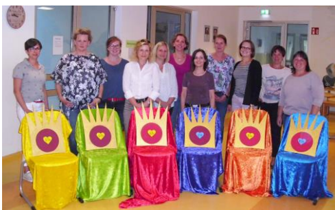
Familiengottesdienstkreis St. Michael