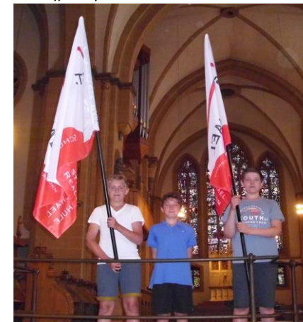
Gemeinsam im Glauben unterwegs: das macht stark!

Glauben erleben in und außerhalb der Schule: die jährliche Domwallfahrt der 6. Klassen aller Bistumsschulen mit Erzbischof Hans-Josef Becker: „Auf, zu den Quellen!“