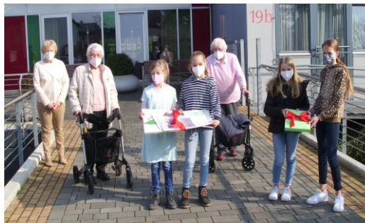
Schülerinnen der R5a und G5a übergeben selbst gemalte Bilder an den Seniorenbeirat eines Altenheims

Schülerinnen und Schüler engagieren sich im Rahmen der Schulseelsorge in caritativen Projekten, wie der Misereor-Fastenaktion, der Flüchtlingshilfe, der Spendenaktion 'Schulmaterial' oder aktuell mit einer Bilderaktion für die Altenheime St. Vincenz und ev. Martinsstift