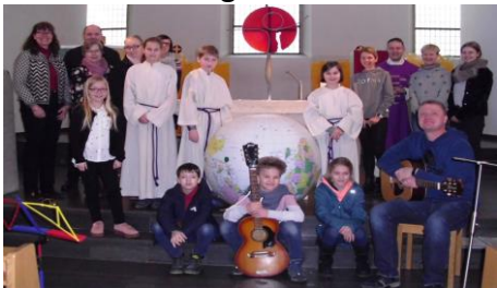
Familienmessen im Jahresverlauf